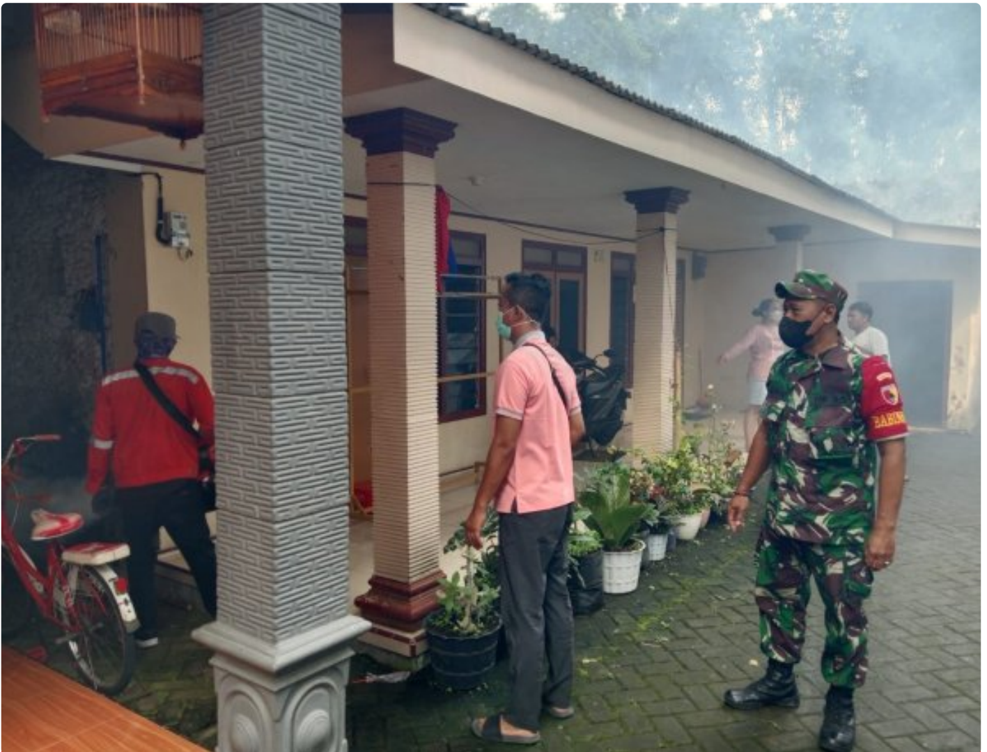
Babinsa Bersama Dinkes Dampingi Fogging, Cegah DBD di Wilayah Desa Binaan

Magetan. Babinsa desa Buluharjo, Koramil Tipe B 0804/02 Plaosan Serka Eko bersama dengan Dinas Kesehatan, Kepala desa Buluharjo dan Perangkat desa melaksanakan antisipasi potensi wabah penyakit demam berdarah akibat dari musim hujan di lokasi pemukiman warga RT 01 s/d RT 03 yaitu dengan cara melakukan fogging atau pengasapan (Pengasapan Pestisida nyamuk) Demam