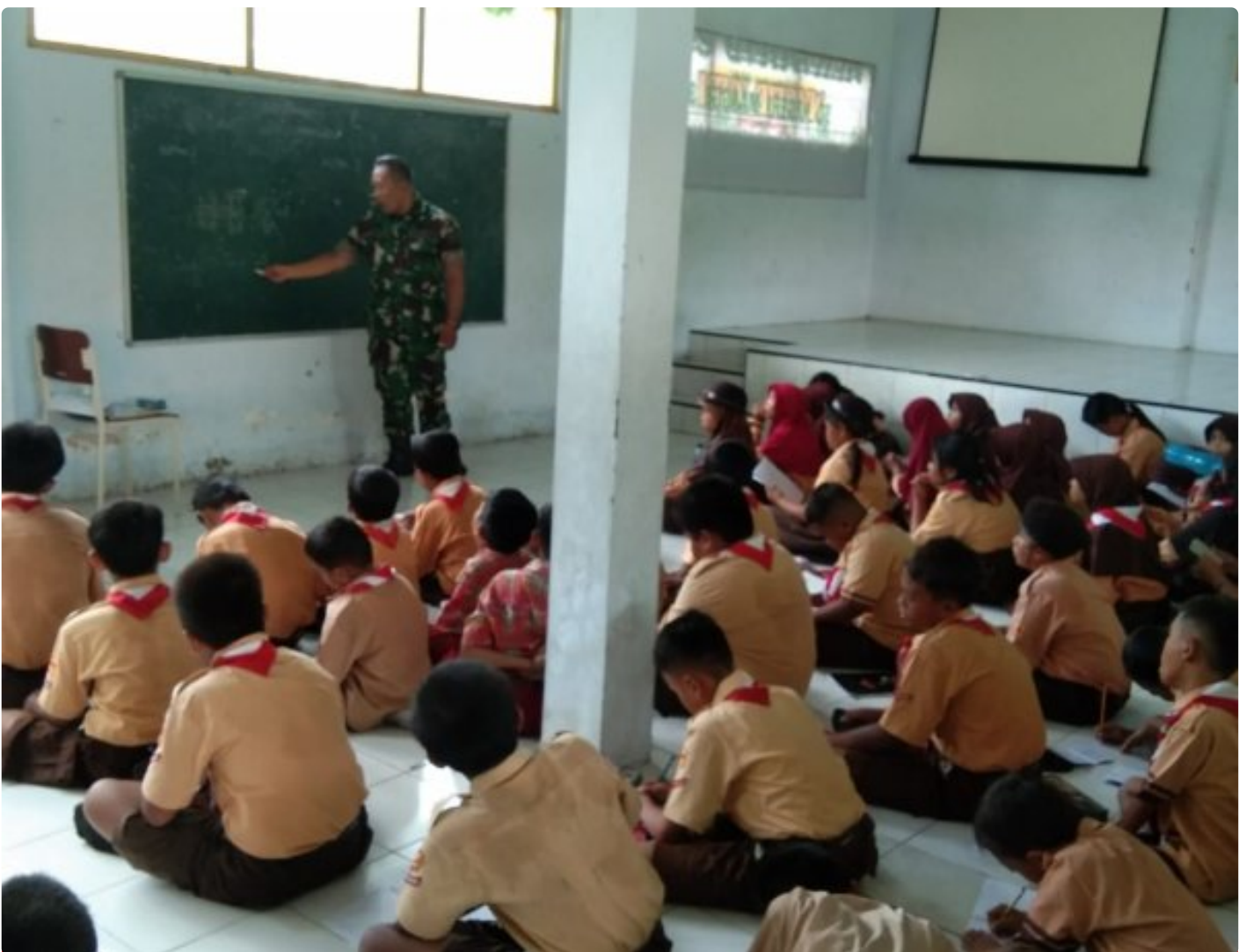
Bersama Babinsa Membangun Karakter Generasi Muda Melalui Pembinaan Pramuka Tingkat SD

Magetan. - Dalam upaya membentuk generasi muda yang berkarakter dan berjiwa patriotik, kegiatan pembinaan Pramuka kembali dilaksanakan di berbagai Sekolah Dasar ( SD ) di wilayah Koramil Tipe B 0804/08 Barat. Kegiatan ini