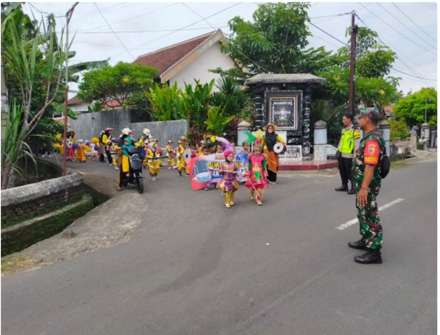
Gebyar Rojabiyah RA dan MI, Babinsa bersama Bhabinkamtibmas Amankan Jalannya Kegiatan Parade Drum Band