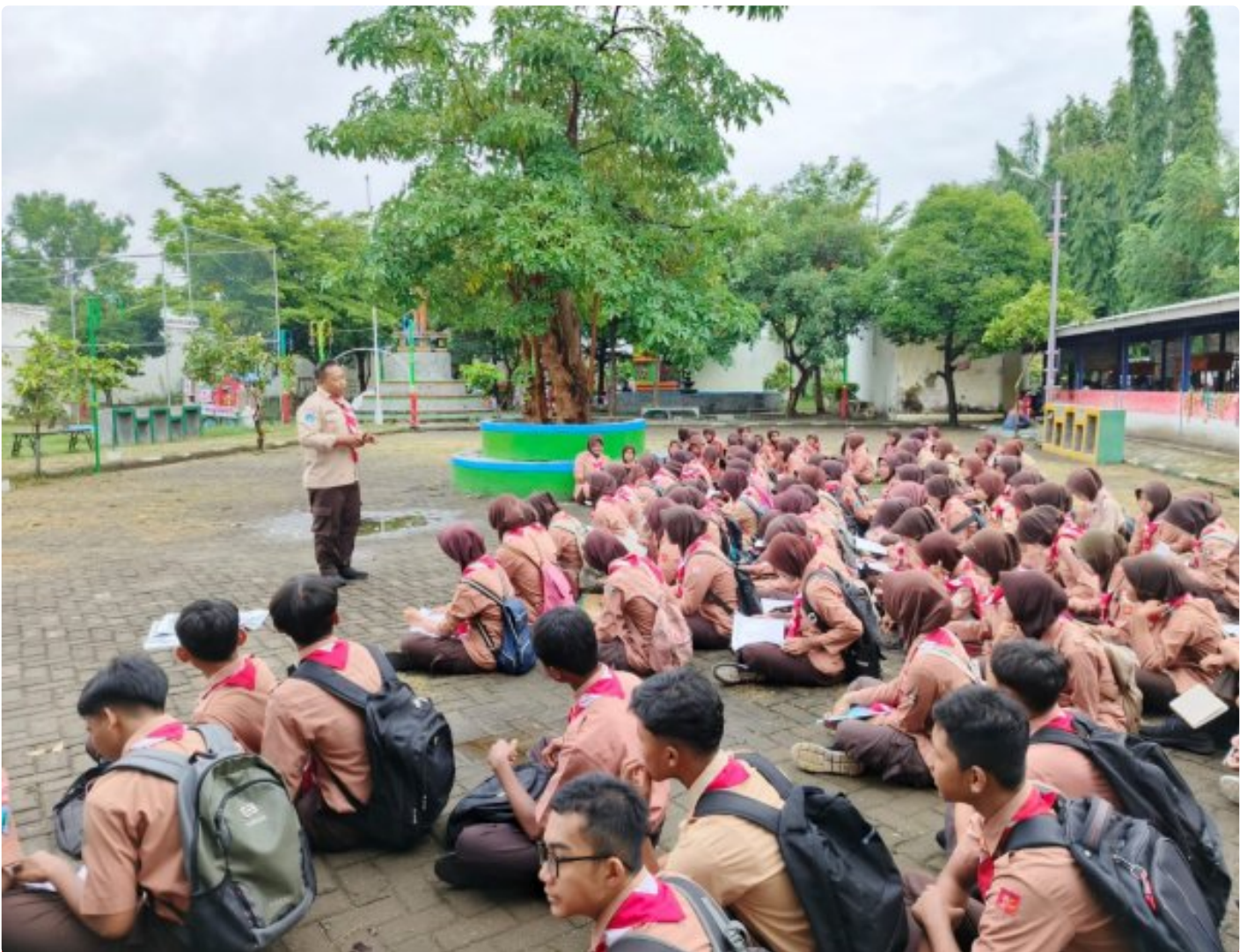
Pembinaan Pramuka Saka Wira Kartika Materi Krida Navigasi Darat Untuk Pengembangan Keterampilan

Magetan. - Dalam rangka memperkuat kemampuan dan keterampilan anggota Pramuka Saka Wira Kartika melaksanakan pembinaan dan pelatihan Krida Navigasi Darat (Navrad). Acara ini diikuti oleh 125 orang anggota pramuka dari